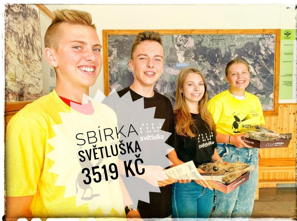
Dobročinná sbírka Světluška v září 2021

S výroční zprávou školy 2021/22 a zprávou o hospodaření školy 2021 budou seznámeni členové Školské rady ZŠ Kravaře na nejbližším zasedání.