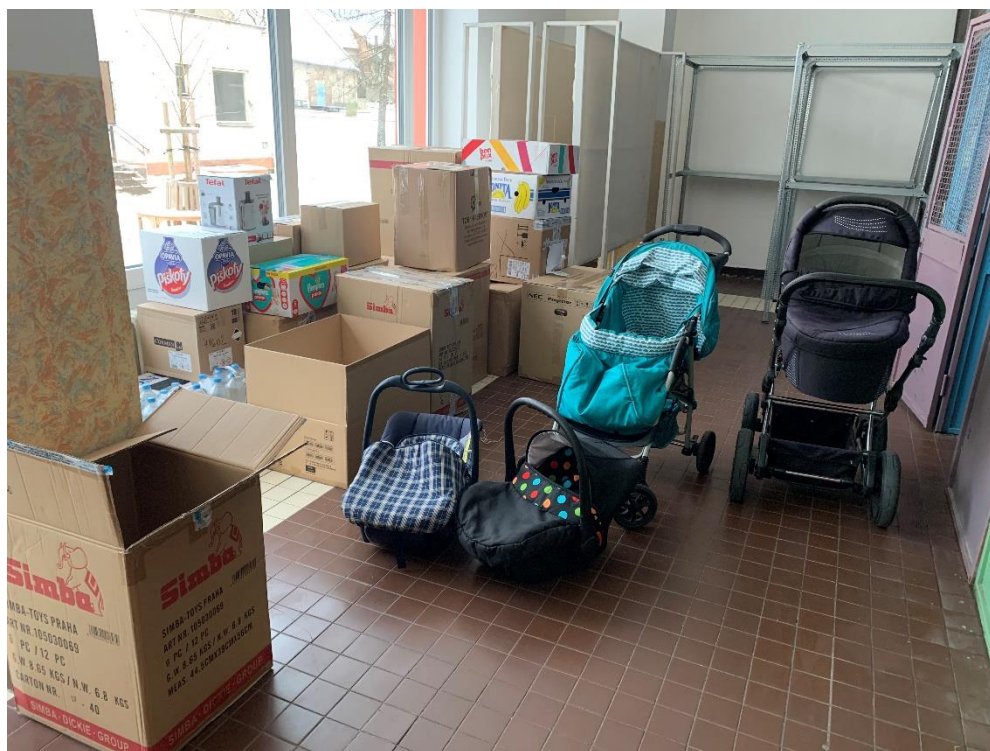
Dobročinná materiální sbírka na pomoc válečným uprchlíkům z Ukrajiny. Březen 2021.