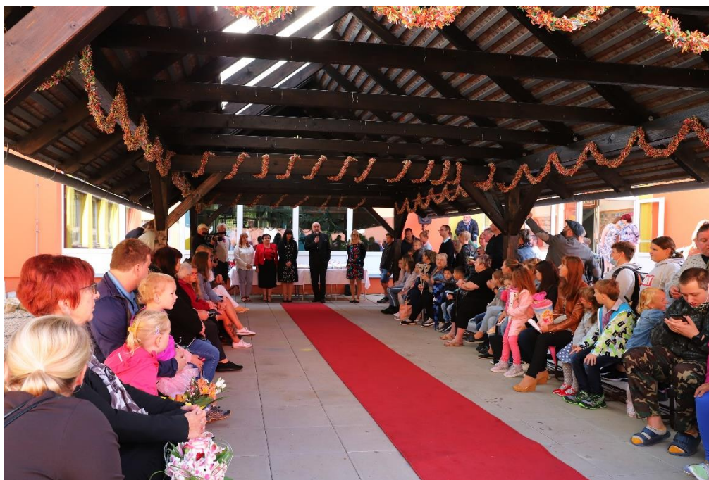
Vítání prvňáčků 1. 9. 2021 ve spolupráci se zaměstnanci Českých drah.

Během školního roku byly bohužel vynechány některé tradiční akce, a to vzhledem k déle trvající výuce online.