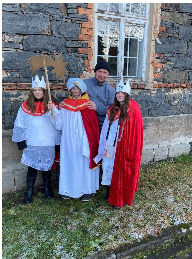
Tradiční Tříkrálová sbírka v lednu 2021.