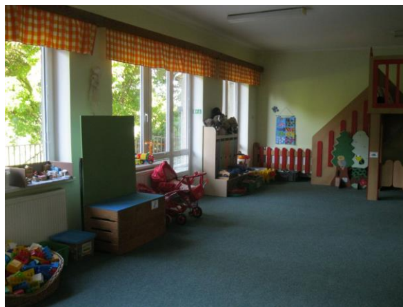
Obrázek 4: Prostor pro hraní