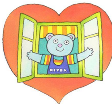
Obrázek 16: Logo projektu Medvídek NIVEA