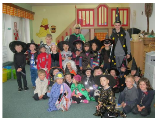
Obrázek 9: Slet čarodějnic