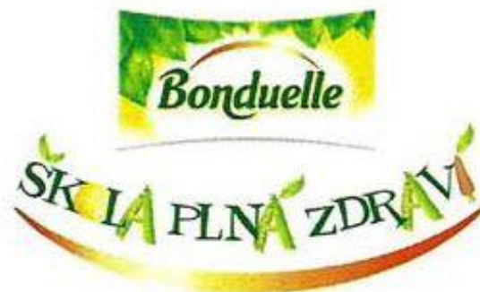
Obrázek 17: Logo projektu Škola plná zdraví