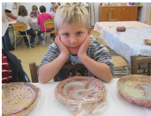
Obrázek 14: Keramika ve ŠVČ Domeček