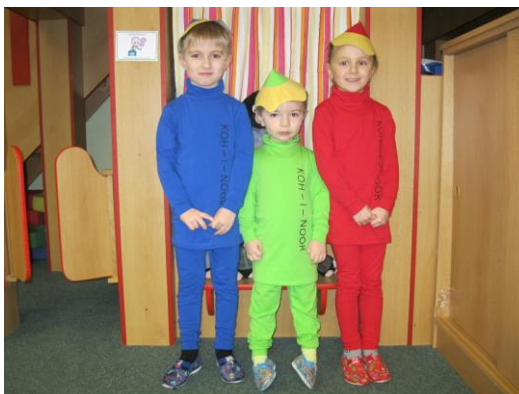
Obrázek 8: Karneval