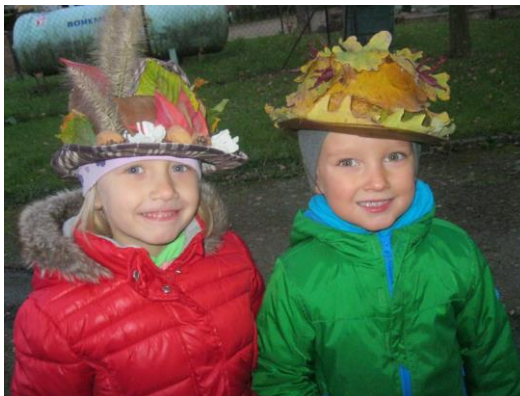
Obrázek 6: Loučení s podzimem