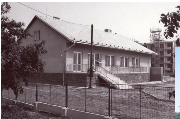
Obrázek 1: Budova MŠ v roce 1977

V budově mateřské školy se nachází jedna třída, která je opticky rozdělena na prostor pro hraní a na jídelnu. Dále je zde také hygienické zázemí a šatna pro děti i personál. Mateřská škola má také vlastní školní jídelnu. K mateřské škole patří také velká zahrada, která je celoročně hojně využívána především pro sportovní aktivity dětí. Zahrada prošla proměnou na „Zahradu v přírodním stylu“, tento projekt byl spolufinancován Evropskou unií z Operačního programu Životní prostředí z Evropského fondu pro regionální rozvoj. Mezi hlavní herní prvky patří zelená učebna, vrbový tunel a pocitový chodníček. Dále mají děti k dispozici dřevěné herní soustavy v podobě hradu a pirátské lodě. Dětem slouží také zastřešené pískoviště a pro společné akce dětí a rodičů ohniště s lavičkami.