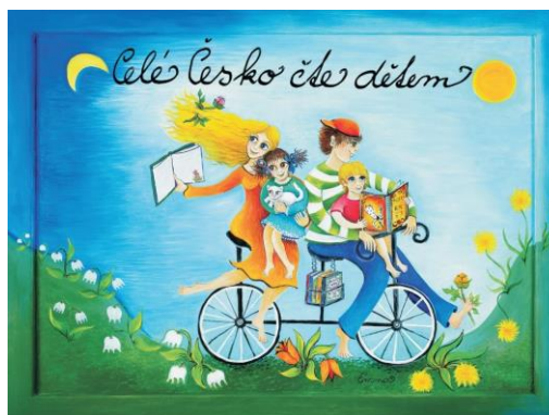
Obrázek 18: Logo projektu Celé Česko čte dětem