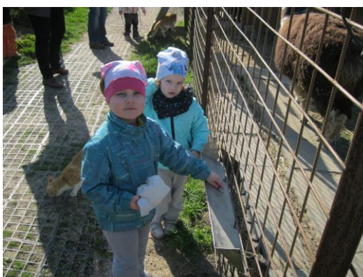
Obrázek 10: Návštěva ZOO Štěpánov