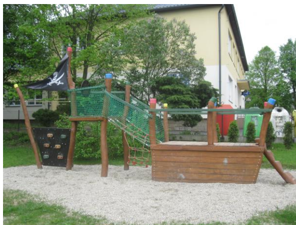
Obrázek 8: Zahrada