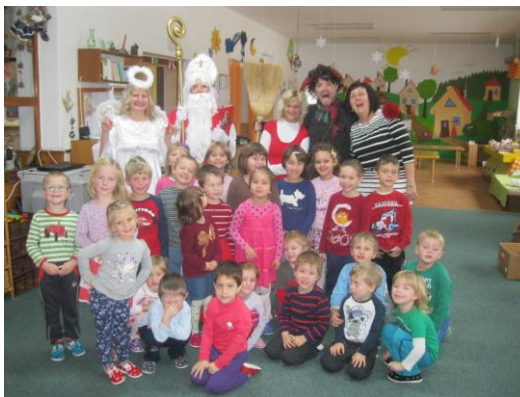
Obrázek 7: Mikulášská nadílka