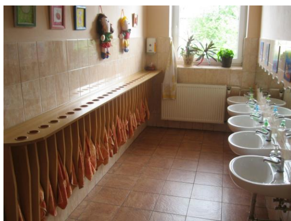
Obrázek 6: Koupelna pro děti