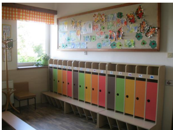
Obrázek 5: Šatna pro děti