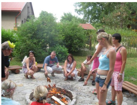
Obrázek 12: Rozloučení se školáky