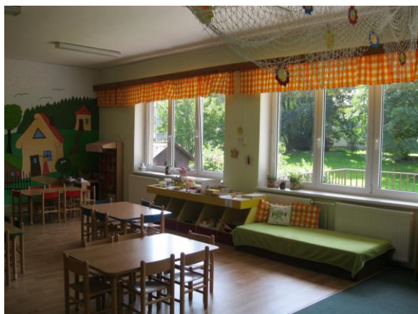
Obrázek 3: Jídelna