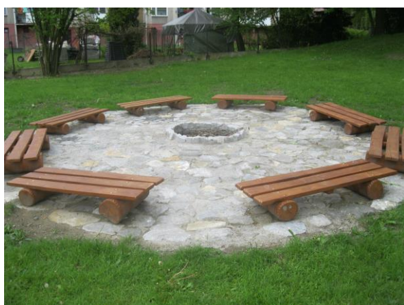
Obrázek 7: Zahrada