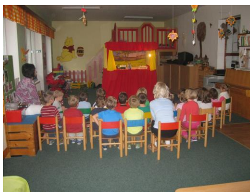
Obrázek 13: Divadlo v mateřské škole