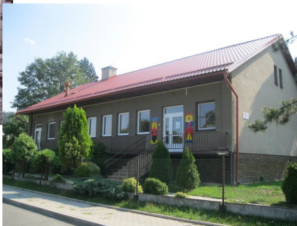
Obrázek 2: Budova MŠ v roce 2016