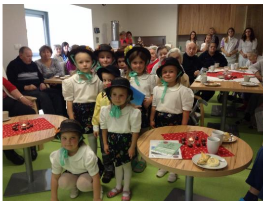
Obrázek 15: Vystoupení dětí v SeniorParku