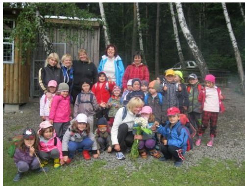
Obrázek 11: Výlet na mysliveckou chatu