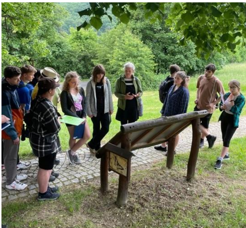
Tradiční ekologický kurz žáků 2. ročníku oboru Ekologie a biologie ve středisku ekologické výchovy ve Vysokém Poli