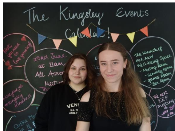
Obrázky jsou z praxí žáků ve firmách v Irsku.