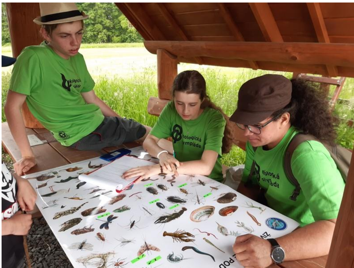
Žáci oboru Ekologie a biologie se opět probjovali do národního kola soutěže Ekologická olympiáda.