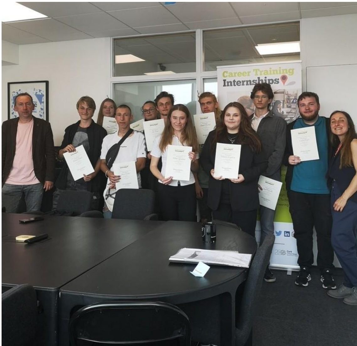
V rámci projektu Erasmus+ pracovali naši žáci v irských firmách v okolí Londonderry a v Corku.