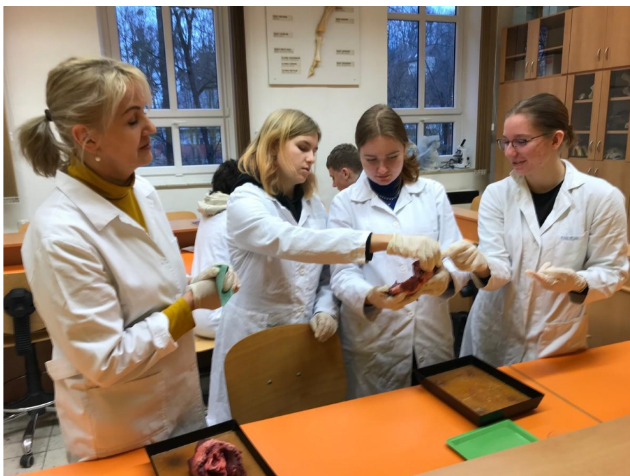
Laboratorní práce z biologie – pitva srdce

Odkaz na celý text zprávy je k dispozici na webových stránkách školy.