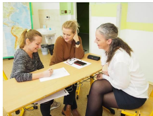
Obr. 1 – obr. 4 pedagogická dílnička, práce na koncepci školy