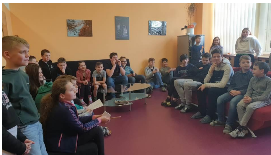
Obr. 5 schůzka s žákovským parlamentem ke koncepci školy