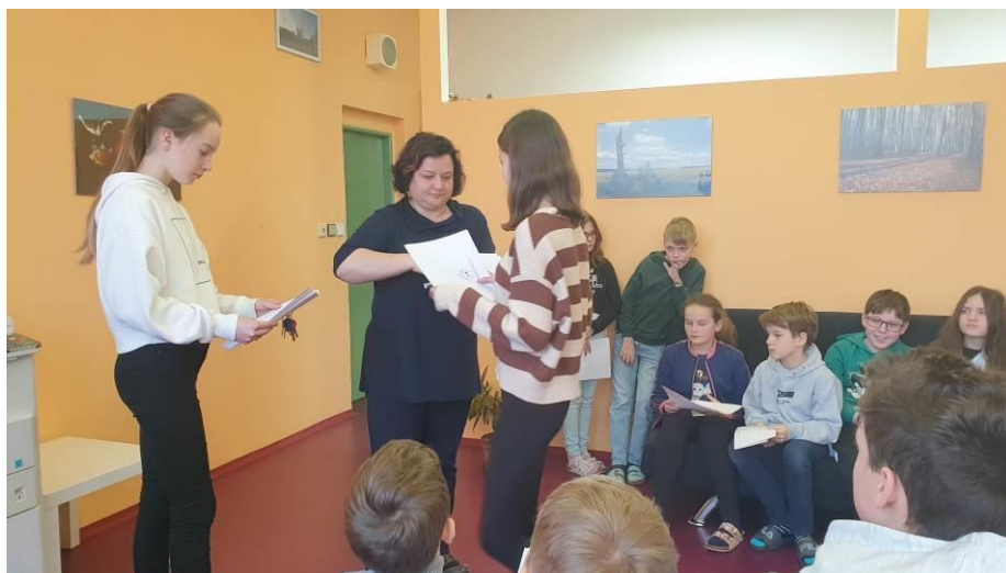
Obr. 6 schůzka s žákovským parlamentem – rozdělení úkolů