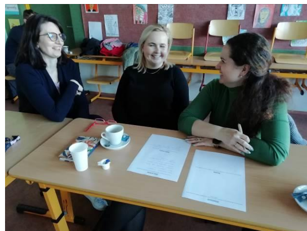
Obr. 7, obr. 8 práce na koncepci školy se zástupci rodičů