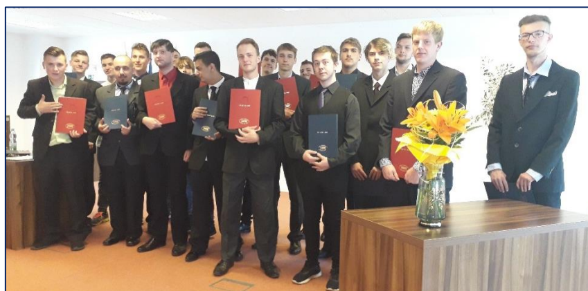
Úspěšní absolventi při slavnostním předávání výučních listů

V tomto školním roce se závěrečná zkouška skládala pouze z písemné a praktické části. Většina žáků ji úspěšně absolvovala, pouze 12 žáků neprospělo. Z 12 neprospívajících je 8 žáků oboru vzdělání Mechanik opravář motorových vozidel -ti pak skládali závěrečnou zkoušku v září 2021.