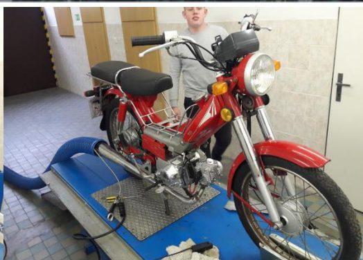
Žáci a jejich stroje v rámci motokroužku