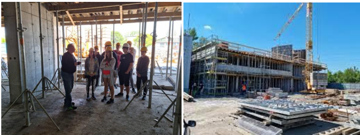
Žáci ve firmě JT Monolity Ostrava