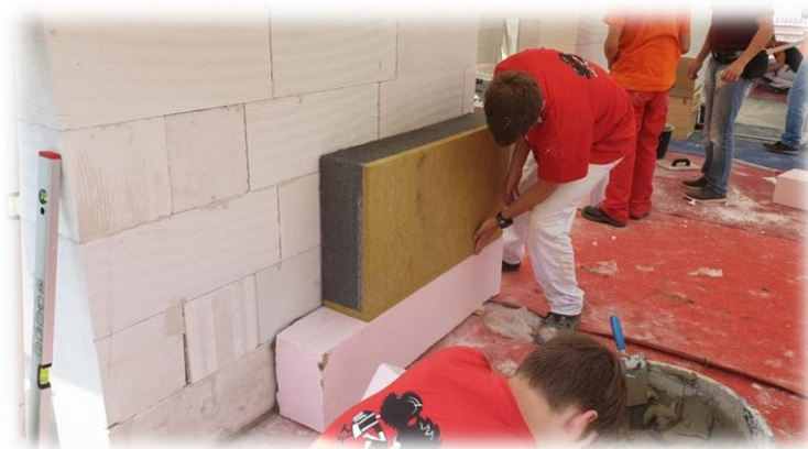
Žáci při řešení soutěžních úkolů

Za velmi významný úspěch naší školy považujeme druhé místo našich zedníků na mezinárodní soutěži „ŘEMESLO/SKILL 2020“ v kategorii Zedník. Soutěžní družstvo ve složení žáků 3. ročníku oboru Zedník ukázalo, že v Havířově učíme řemeslníky, kteří dobře obstojí i v mezinárodní konkurenci.