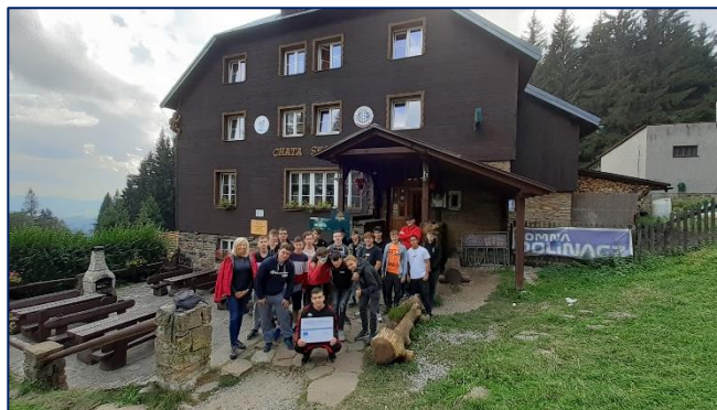
Motivační workshop na Skalce

možnostech uplatnění žáků po dokončení studia daného oboru. Na realizaci aktivity navazují třídnické hodiny, metodická podpora a vzdělávání třídních učitelů.