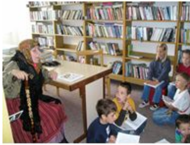
V místní knihovně je to „pohádkové“