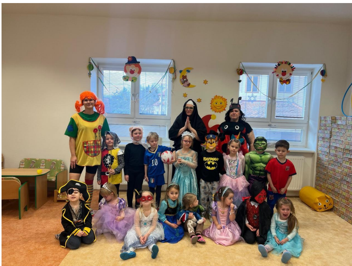
Karneval v MŠ