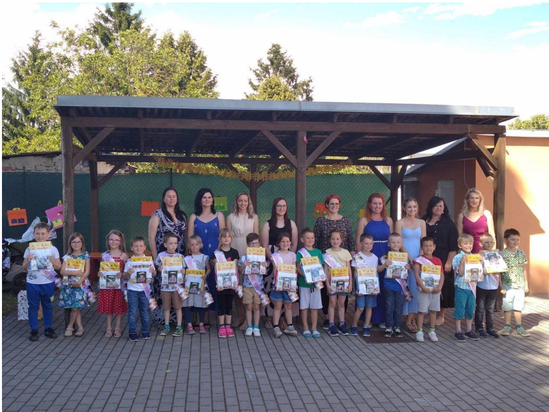
Rozloučení s předškoláky