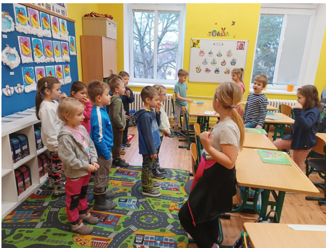
Návštěva v ZŠ dětí s povinnou předškolní docházkou