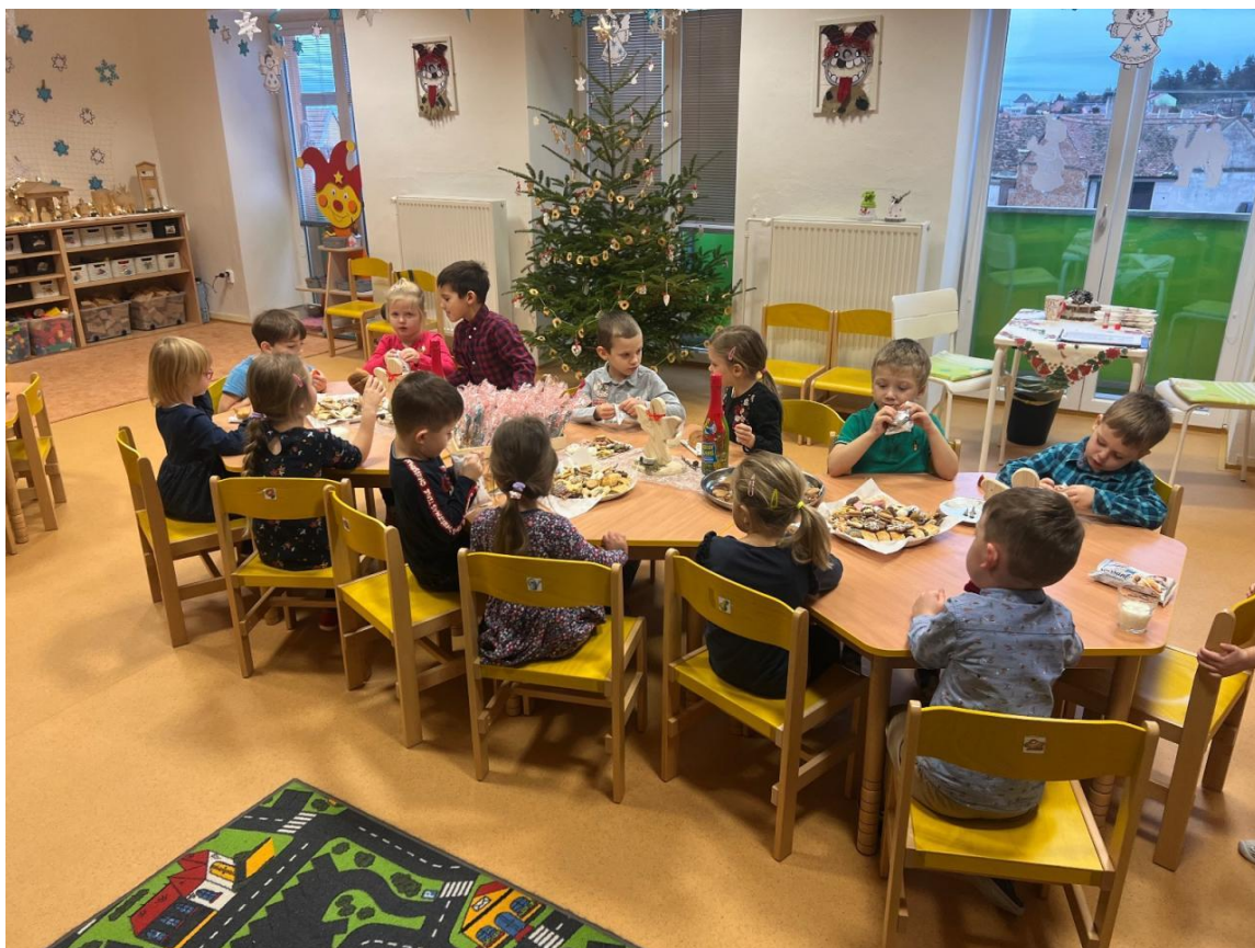
Vánoce v MŠ