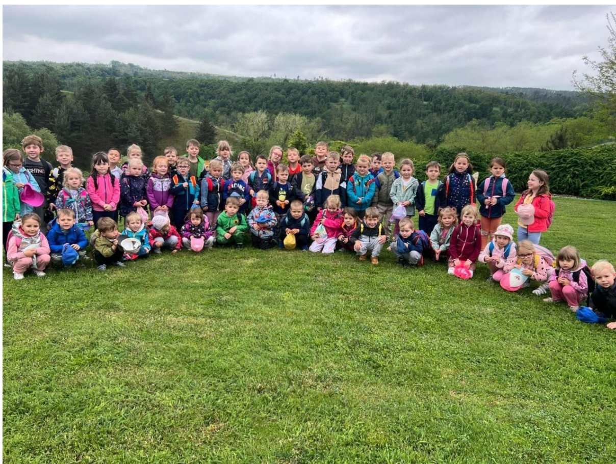
Výlet – Čarodějnický dvůr Biskoupky