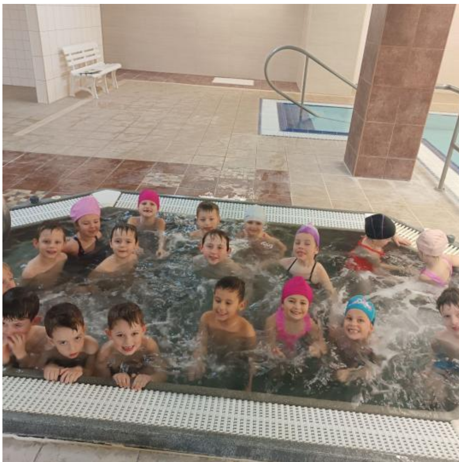
Plavání pořádané ve spolupráci s Relax Božice