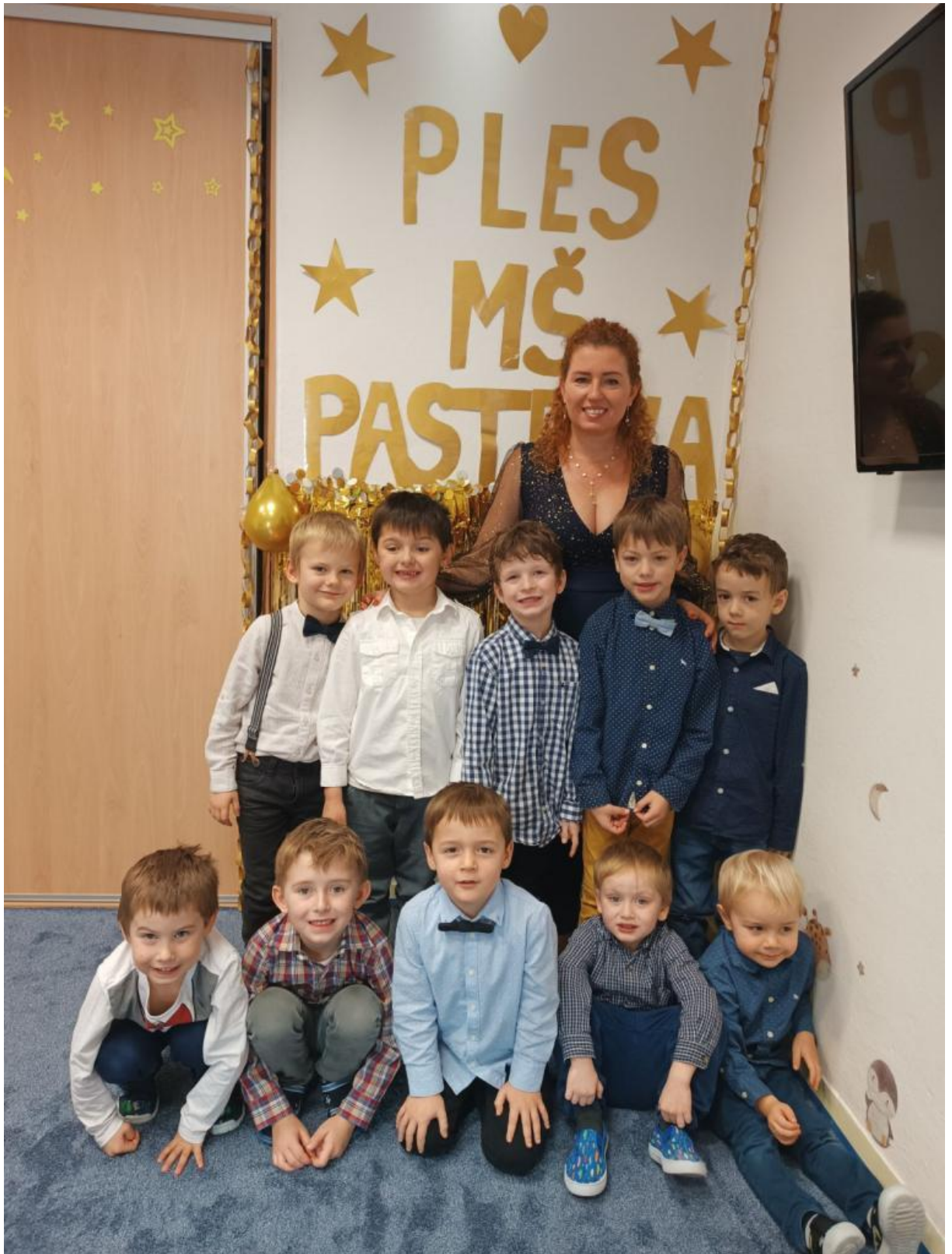
Ples v MŠ