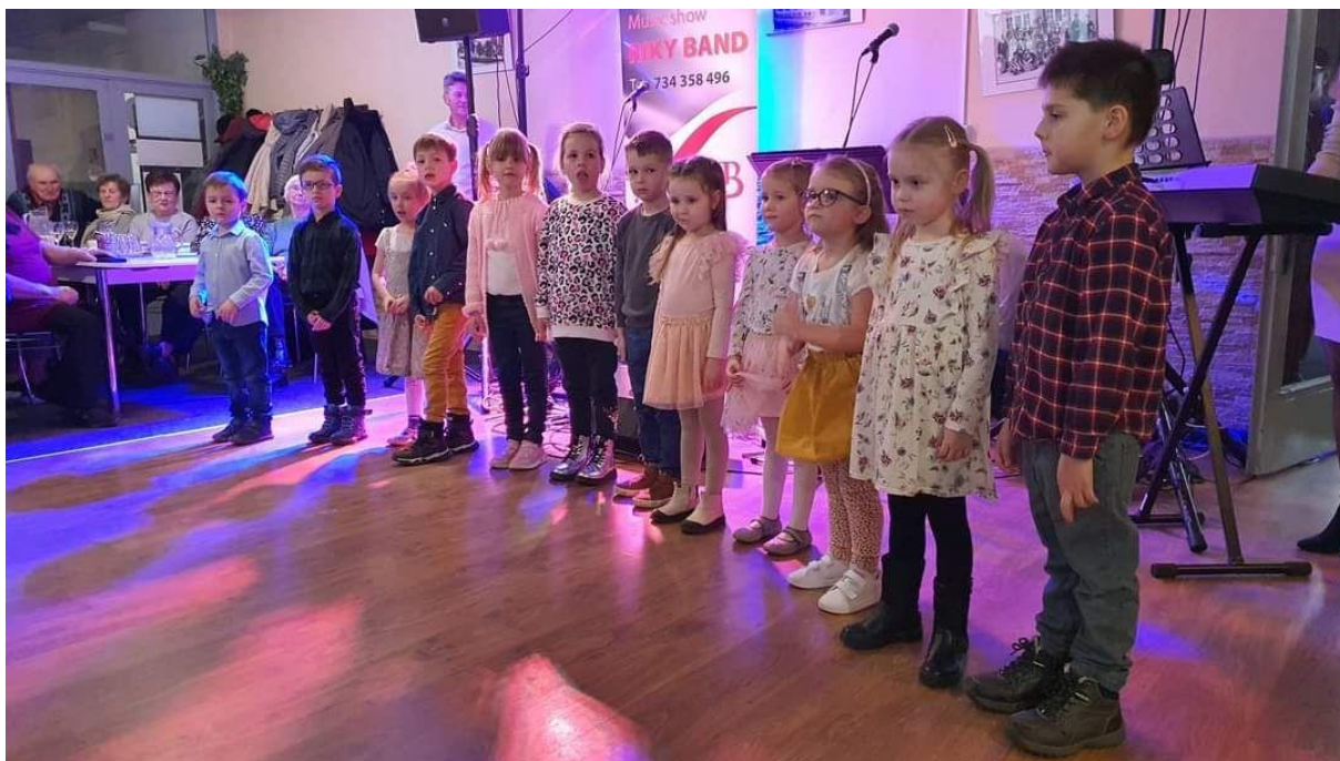
Vystoupení pro seniory ve Slávii