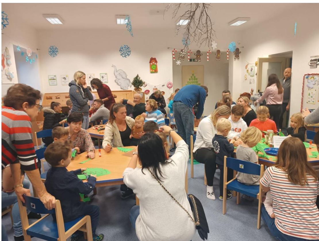
Vánoční besídka a tvoření s rodiči