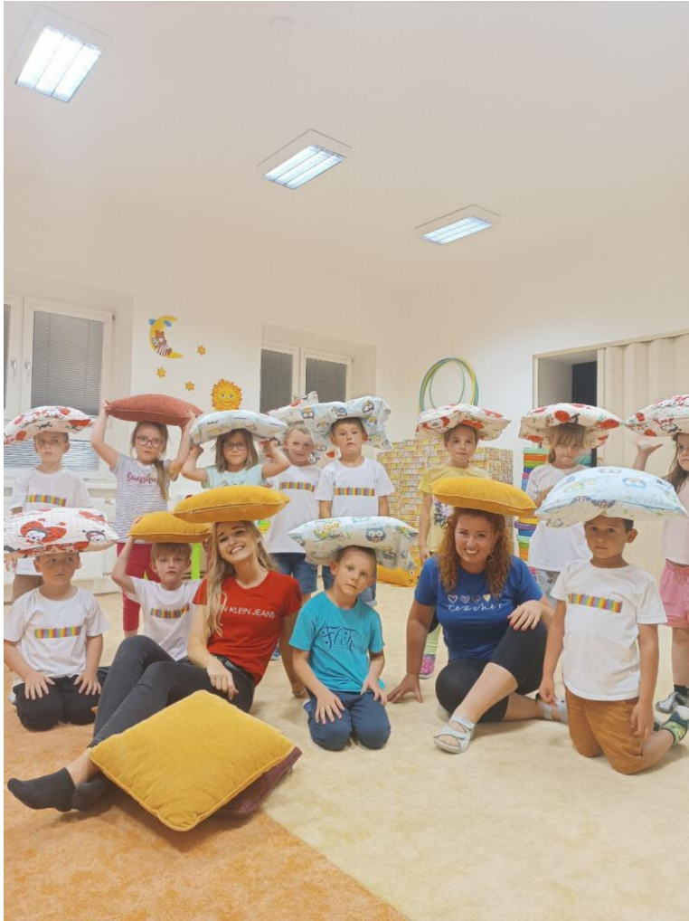
Spaní v MŠ