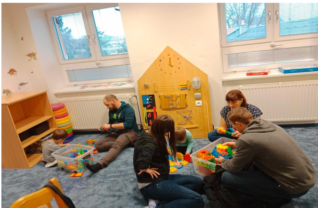
Akce s rodiči – „Maminko, tatínku, pojď si hrát na hodinku“