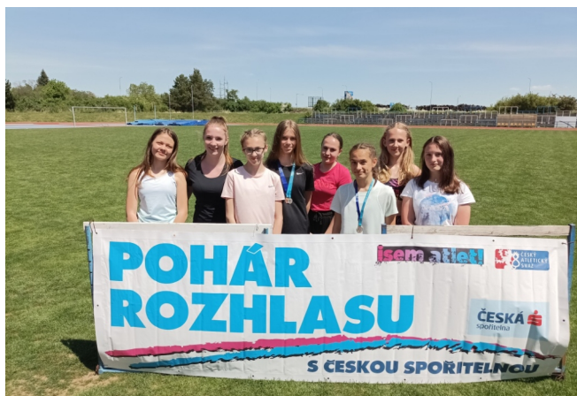
Tradiční atletická soutěž škol se konala 18. 5. na atletickém stadionu TJ Spartak Třebíč.