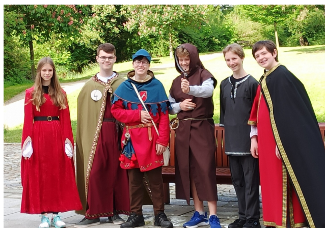
Dějepisné soutěžení v areálu třebíčského zámku.