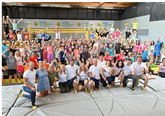
Projekt Sazka olympijský víceboj funguje od roku 2014. Naše škola se zapojila asi před šesti lety.