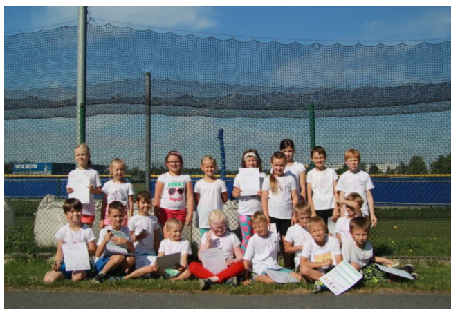
T-Mobile Olympijský běh. Účastnila se i naše škola.