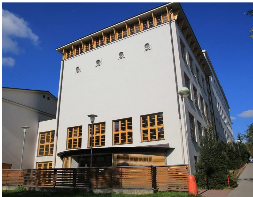
Přístavba budovy školy (vstup z parku)

Škola se snaží neustále modernizovat svoje vybavení a zajistit tak kvalitní zázemí pro naplňování ŠVP.