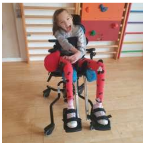
Kompenzační pomůcky zakoupené z darů