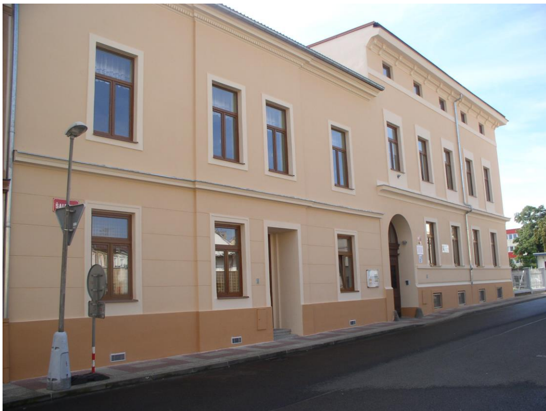
budova Praktické školy dvouleté