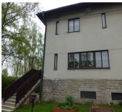
Mateřská škola č. p. 130