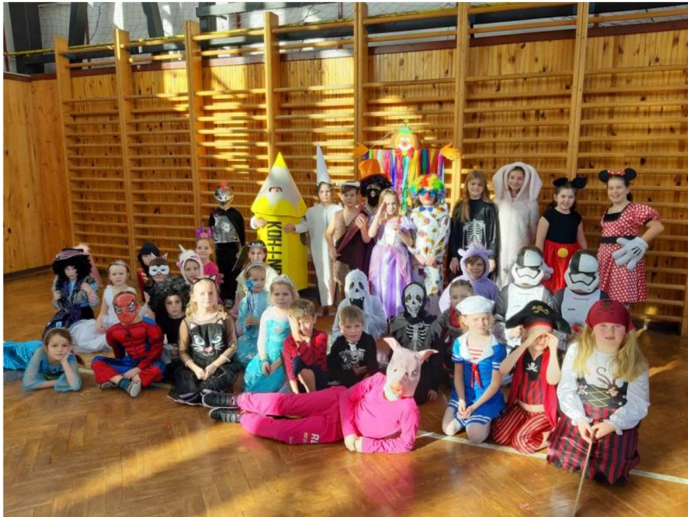
Karneval - ŠD