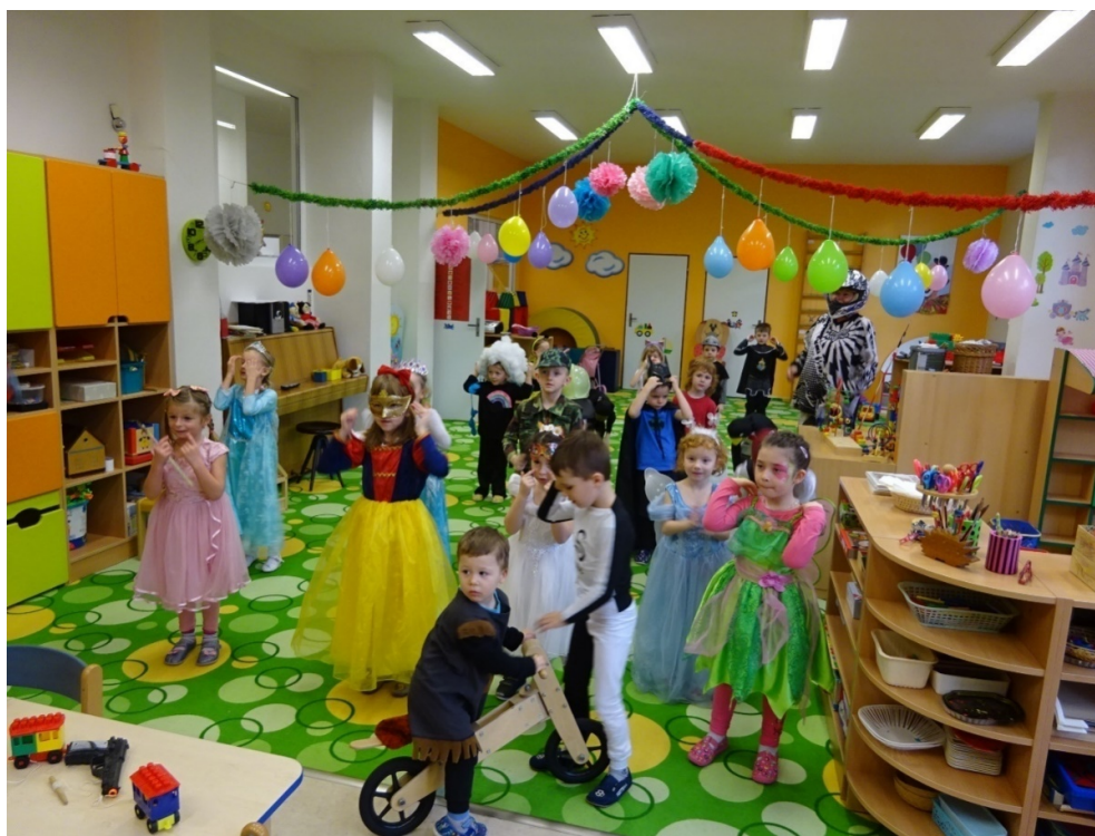
Karneval - MŠ