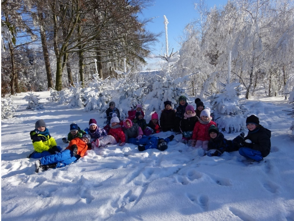
Vycházka - MŠ