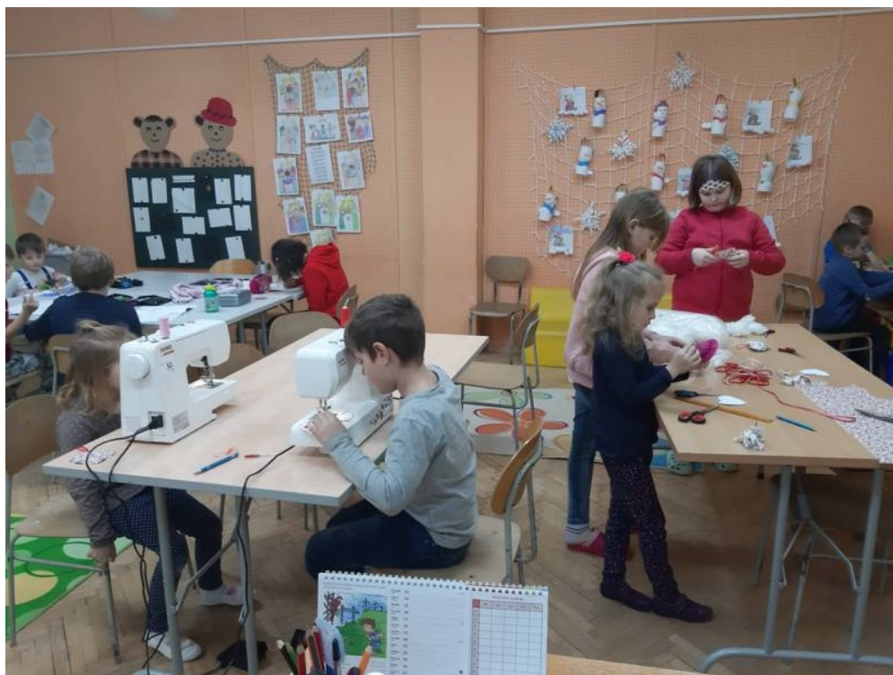
Valentýnské srdíčka – práce na šicím stroji- ŠD