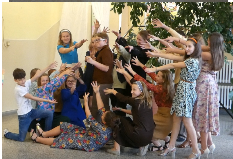
Oslavy výročí 60 let školy v Benešově.