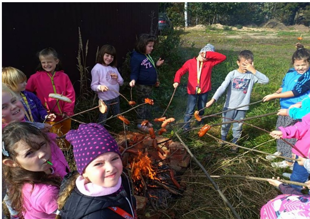
Opékání špekáčků -ŠD