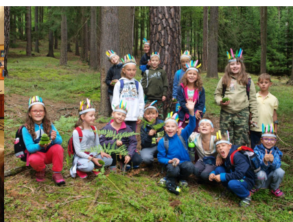
3.A - indiáni