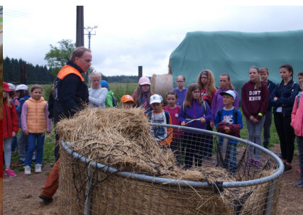
Žáci školy na statku u p. Křižana