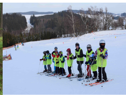
Lyžařský výcvik 1. stupně