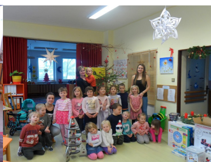
2. třída MŠ - Motýlci