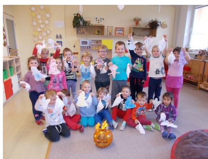
1. třída MŠ - Sluníčka