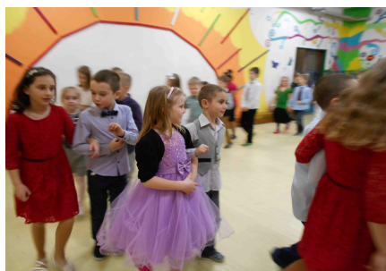
Ples školní družiny