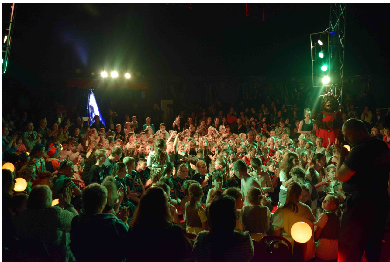
45 let školy – cirkusové vystoupení žáků školy v cirkuse Happy Kids

Umí komunikovat a naslouchat , stále se vzdělává, má všeobecný přehled o světě , chápe kontinuitu minulosti a současnosti, ovládá a využívá výpočetní techniku , má dobré vztahy, je tolerantní, umí pracovat s informacemi a textem , stará se o své zdraví, umí odpočívat a zvládat stres, bere na sebe zodpovědnost , umí zhodnotit své schopnosti, umí pružně reagovat na různé situace , umí hledat různá řešení, váží si kulturního dědictví a umění , mluví dvěma cizími jazyky, je schopen práce v týmu , umí plánovat a organizovat, umí se o sebe postarat , umí se prosadit, obhájit svůj názor, orientuje se v přírodě , má k ní pěkný vztah , rozvíjí pracovní návyky a dovednosti.