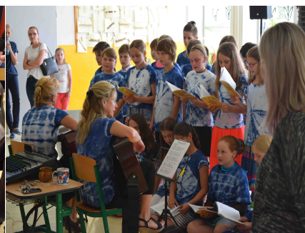
Rozloučení 5. ročníku