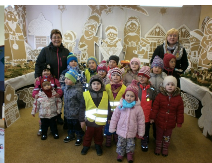
3. třída MŠ - Berišky