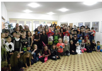
Den v maskách