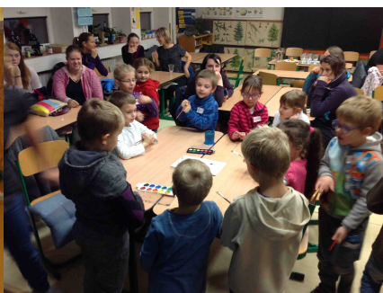
Kavárna s rodiči