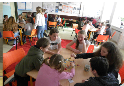
Den her žakovského parlamentu