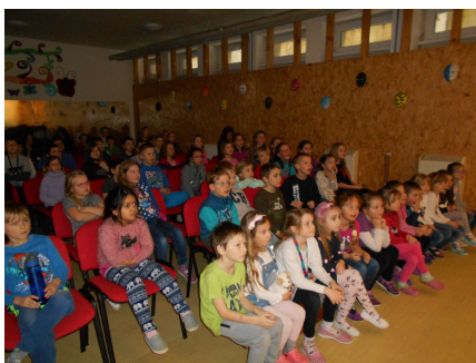
Divadlo školní družiny

V uvedeném školním roce ve škole nestudovali žáci s jinou státní příslušností.