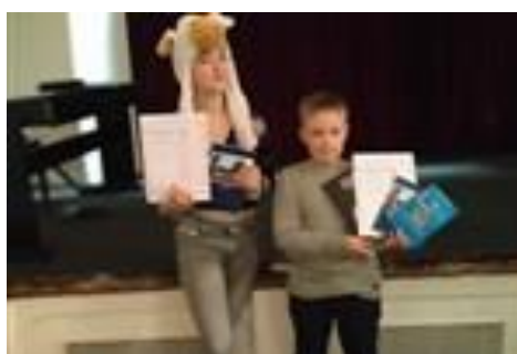
Recitační soutěž, krajské kolo, vítězové