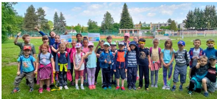
Šípkovaná, poklad (zmrzlinový šek)

Rozsáhlejší fotodokumentaci ze školních i třídních akcí je možné zhlédnout v kategorii fotogalerie školního webu: http://www.skolalhota.cz/