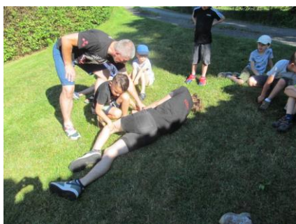
Zážitková první pomoc